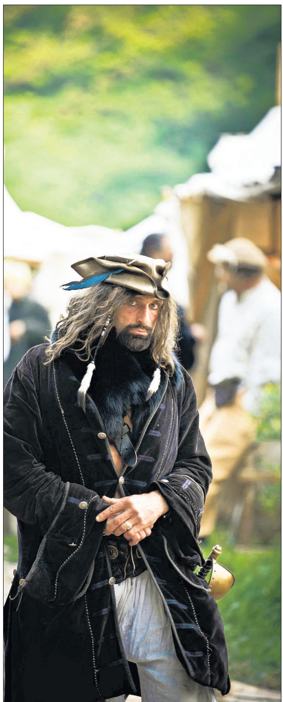
Im Mittelalter verirrt: Ein Mann in einem Kostüm, das ans 18. Jahrhundert und den Piratenfilm „Fluch der Karibik“ erinnert, auf den Göppinger Staufertagen

Sich dem zu öffnen, das zu genießen und schlichtweg Freude zu haben am Kleiden, Spielen, Zuschauen – das machen die Mittelalterzentrierungen in Fülle möglich. Und enttäuschen auch den nicht ganz, der gestiegerten Wert darauf legt, dass hier Authentisches geboten wird. Denn in ihrem Kern sind ein Mittelaltermarkt und ein Markt im Mittelalter völlig gleich: Der Sinn liegt im Sehen, Gesehenwerden, in Unterhaltung, Spaß und einem guten Geschäft. 1214 nicht anders als 2012.