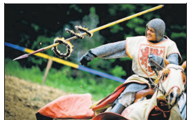
1298 in einer Schlacht verwundet wurde und im Kloster Salem in Linzau starb.