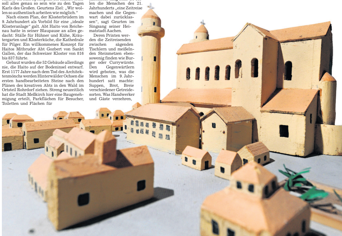
Ein Modell, das die historische Klosterstadt in Anlehnung an den Plan von Sankt Gallen darstellen soll